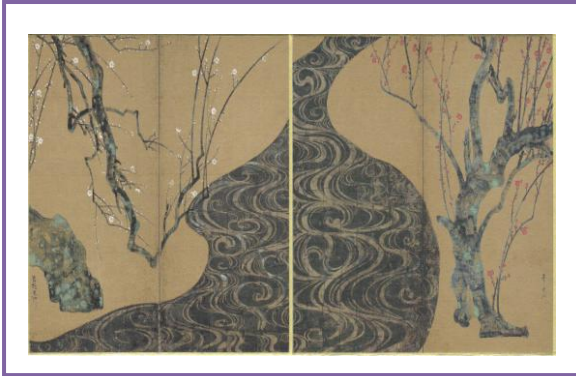
〈 国宝 「紅白梅図屏風」 〉 尾形光琳 琳派展 2/1~3/20 MOA 美術館にて展示